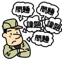
問題・課題を整理