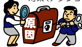
再発防止に繋げる