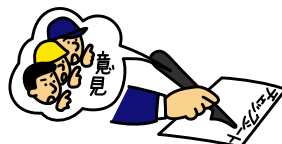
項目別評価を実施